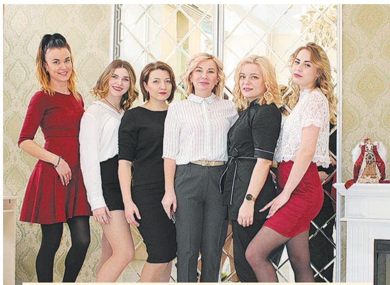
Вам всегда рады по адресу: ул. Ленинградская, 48. Салон «VIKTORIA BEAUTY» работает ежедневно с 9.00 до 21.00.